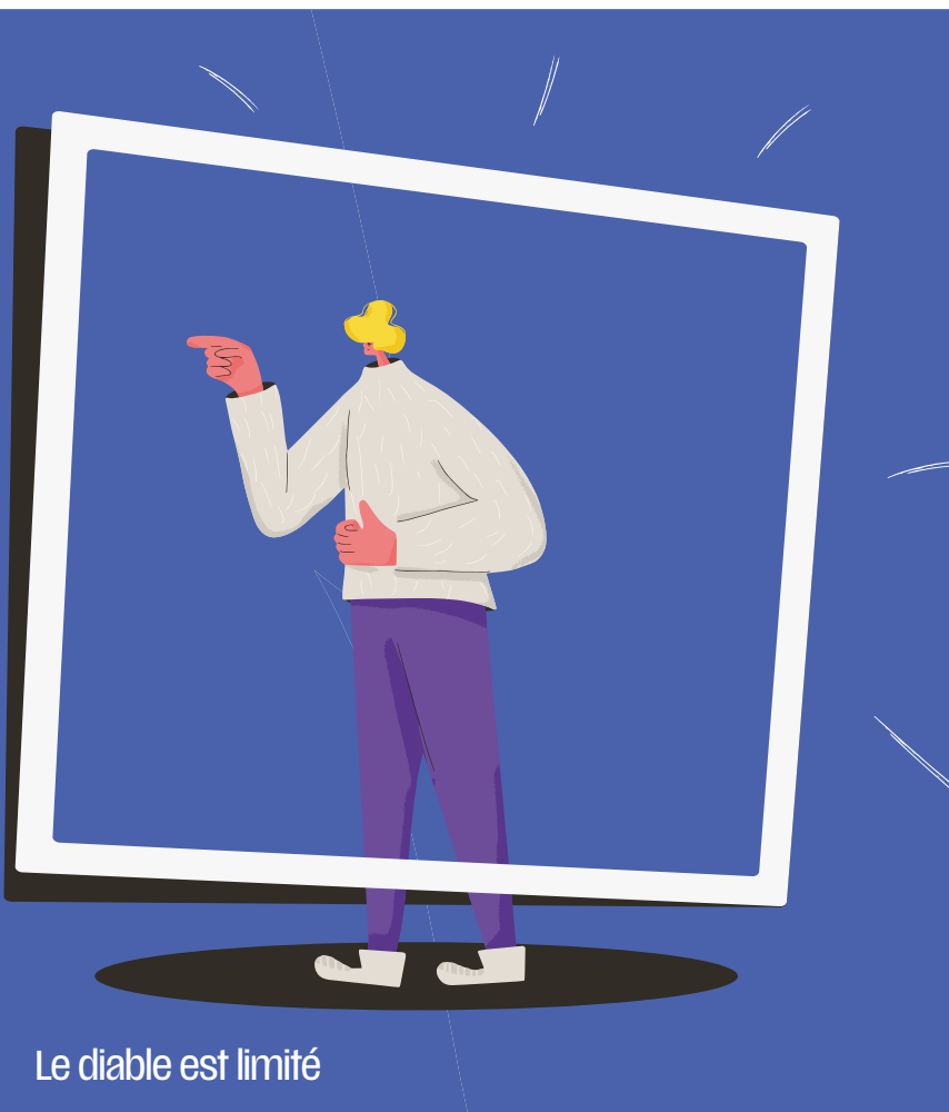
Le diable est limité

Le diable est puissant, mais il est limité par sa nature (ce n'est qu'une créature), par son champ d'action, par le temps dont il dispose, par ses moyens d'action et dans ce qu'il a le droit de faire ou pas (voir le début de l'histoire de Job en Job 1.6-12 et 2.1-10 ou la façon dont Dieu permet les épreuves dans la vie des chrétiens en 1Corinthiens 10.13).